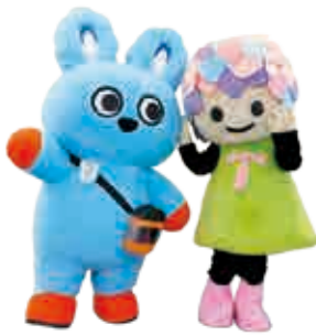
▲ 小田急電鉄の子育て応援担当「もころん」