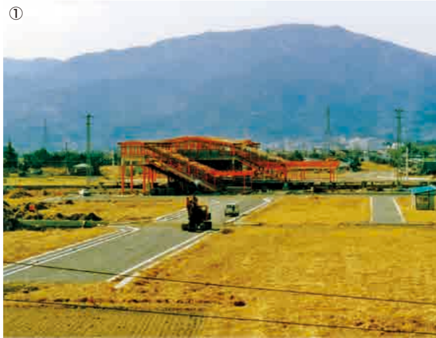
① 建設中の開成駅 ② 西口のロータリー(写真は2003年頃) ③ ロマンスカー3100形デハ3181(ロンちゃん)は今年で誕生60周年を迎える