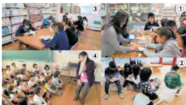
①図書司書のいる図書室②③図書室の様子④本読みママさんの読み聞かせ