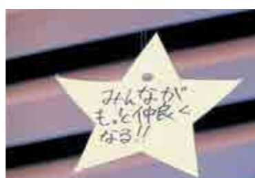
生徒が作成した星型カード