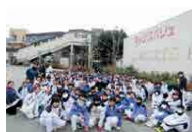
心洗組に参加した生徒たち