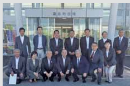
嘉島町の皆さまと

また、今年は自然災害 （地震・風水害）が多発し、 日本中で甚大な被害が発生 した。想定外の災害が発生 したとき何を行うことが重 要であるか、復興に向け何 を行なっていくべきかを体 験地で体験から学んだこと について聞き取り、町及び