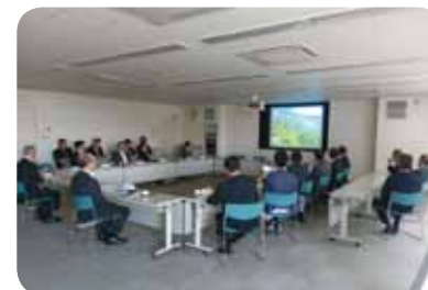
嘉島町視察の様子

委員会では、防災行政無線の運用状況 と課題及びデジタル化にむけての今後の 運用方法などを調査しています。 調査にあたり、10月3日の県外行政視 察において、熊本県嘉島町の災害復興へ の取り組み、防災行政無線の運用方法な どを視察いたしました。その後、委員会 で議論し、12月の定例会議において、所 管事務調査報告を行う予定です。