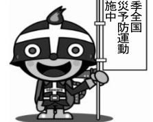
小田原市消防マスコットキャラクター ファイヤーけしまるくん