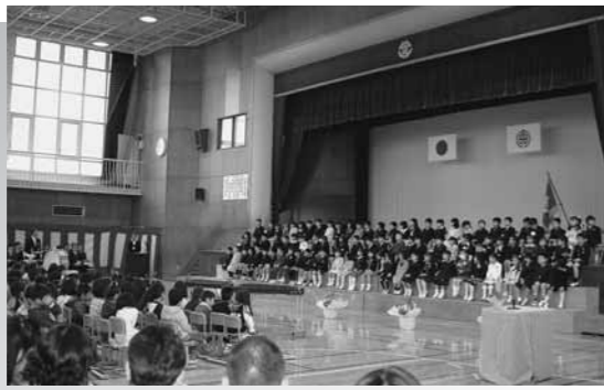
開成小学校の入学式の様子

4月5日(月)開成小学校でも入学式が行われました。在校生児童が半分になりましたが、みんな笑顔で元気いっぱい入学式を迎えることができました。