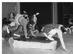
「劇遊びをしている場面」

本物の2匹のやぎを見てとに驚いたり「フワフワしてたよ。」と触った感想を教えてください。餌をあげることを楽しんでいました。『がらがらどん』のやぎは3匹なのに何で3匹いないんだろう?と、すっかり絵本の世界に入っている子どももいてとてもかわい