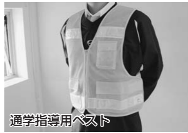
通学指導用ベスト