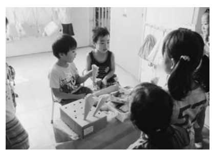
いらっやいませ「来てくれてうれしいな」～お店屋さんごっこ～

人の顔を描いてサッカーゲームを作りました。マンガでやっているような必殺技をして、手でボールを持って遊ぶ子がいました。「サッカーは手を使わないだよ」だってそうしなきゃ必殺技ができないんだよ」でもそうするならばいから一緒に遊ぶの嫌だ」しばらく考えていた子はそのときから手でボールを触ることをやめました。一緒に遊ばたい、だから皆が楽しく遊べるようにと考えたのでしよう。