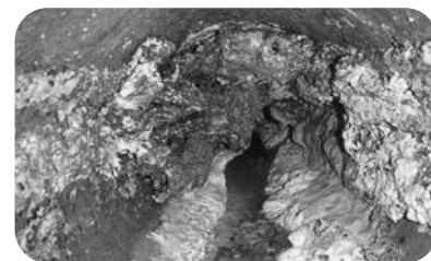
下水道管に油脂分が固形化した状態

開成町の公共下水道で油脂分が下水道管へ流入することにより、下水道管のつまり(閉塞)状態が発生しました。油脂分(ラード)は温度の低下により固形化する特性を持っており、台所から油脂分を下水に流すと、はじめは液状であっても、下水道管を流下する間に固形化し閉塞の原因となります。下水道が閉塞すると、汚水がつまり環境