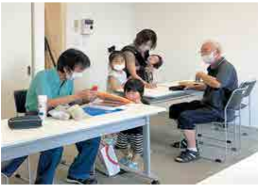
「おもちゃの治療中。「修理するよ」