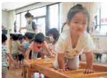
▲ 次のお友だちどうぞ～