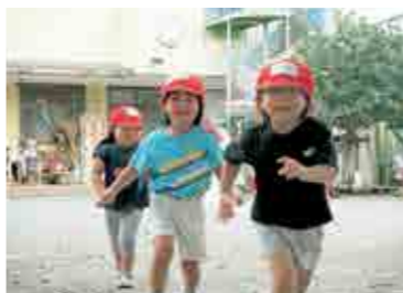
▲ 運動会ごっこがはじまるよ