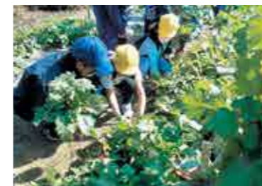
▲ コツを聴きながら一緒に収穫！