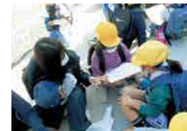
▲ ダイコンレシビを教えてくださいました！