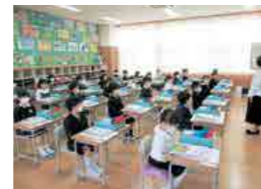
▲ しっかりと話を聴けました