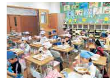
▲ みんなで給食、おいしいね!