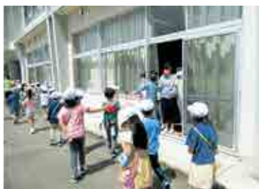
▲「お帰り!」のお出迎え