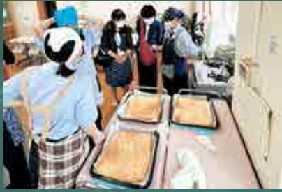
▲子ども食堂のメニューを試作中

町内唯一の高校「県立吉田島高校」(通称、吉高)。 吉高生たちを、特命まちづくり情報特派員に任命し、 学校の出来事をレポートしてもらいます。