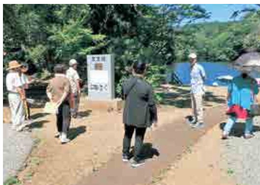
◀ 震生湖で関東大震災の跡を巡検中