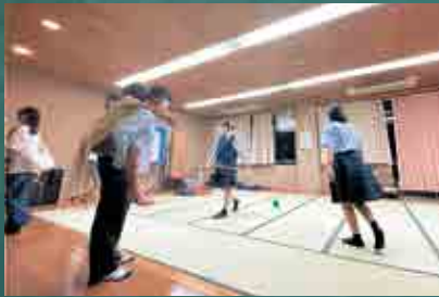
▲子どもたちは元気いっぱい!