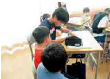
▲1年生・6年生の授業交流

いろいろ試してもダメな場合は、第三者にサポートをお願いして、保護者の休息にここがけましょう。また、夜泣く理由は様々です。 悩んだらすぐに町子育て健康課に相談してください。 生活リズムや食事の内容を確認して、いっしょに夜泣きの対処法を考えましょう。