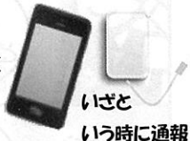
携帯電話と予備電池