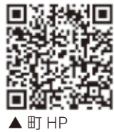
▲ 町 HP

令和6年度は、まちづくりの方向性を定める最上位計画である「第五回開成町総合計画」の最終年度にあたります。「明るい未来に向けて人と自然が輝くまち・開成」の実現に向けて、社会環境の変化への対応や生活環境の質を向上させる施策に重点を置いたまちづくりを進めます。