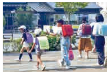
▲また明日会おうね！バイバイ

ちが学ぶ内容を、実際に見て聞いて感じることで、とても良い刺激になっているのではないのでしょうか。