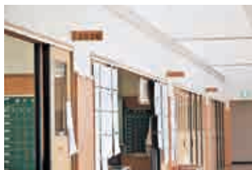
▲異学年で隣りあう教室

開成南小学校では、異学年交流を盛んに行っています。昨年度から始めた、異学年のクラスが隣りあう教室配置もその一つで、1年生と6年生、2年生と4年生、3年生と5年生のクラスが交互に配置されています。どんな勉強をしているか、どんな作品を作っているのかなど、お互いの学習について知る機会となっています。また、異学年の授業を見合うこともあります。上級生は上級生としての自覚を、下級生は上級生の難しい勉強に取り組むかっこいい姿やこれから自分た