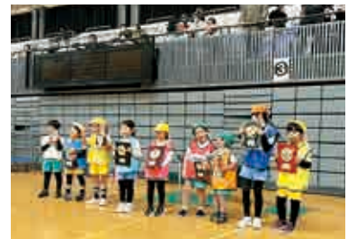
▲カップとトロフィーが全チームに

卒園から入学へと、子どもたちの生活が一変していきます。年長クラスのお友だちが、2年間園バスで通ったフットサル教室も最後になります。2月中旬、小田原アリーナで「三園交流フットサル大会」が行われ、みずのべ・みなみの保育園の年長クラスのお友だちと一緒に、フットサルを楽しみました。