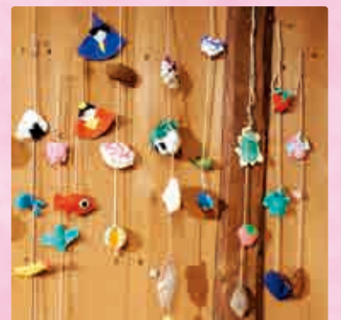
▲開成小6年2組制作「みんなのつるし雛」