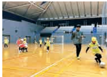
▲走って・走って・走りました！