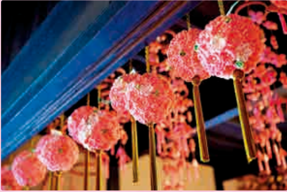
▲ 開成町婦人会による今年の新作 ▶