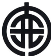
町章 昭和31年2月1日制定