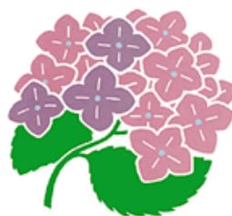
町の花「あじさい」 昭和52年6月6日制定