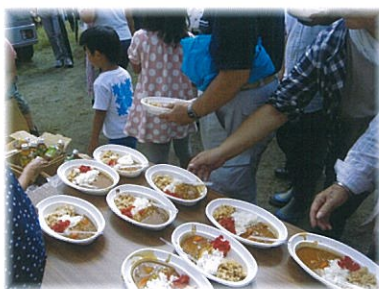
好評のカレーライス! 😊