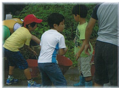
こども達も真剣に参加しました