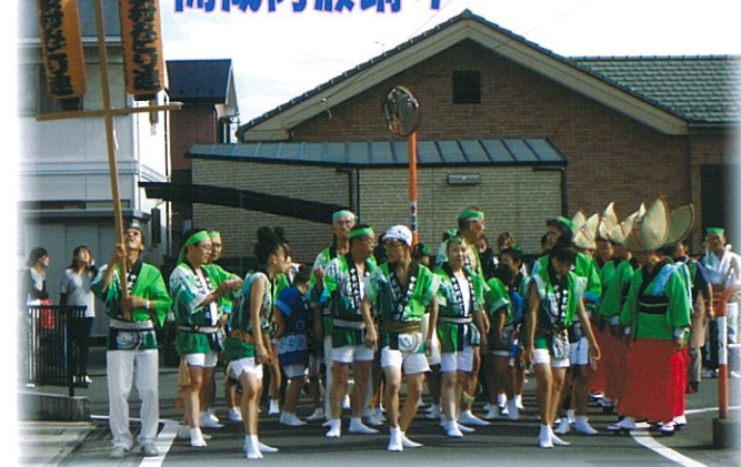
『みどり連の皆様、PM3時中家村公民館集結。さ〜出陣!』