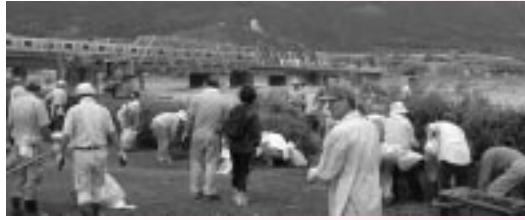
台風9号のあと流木等の撤去作業をする住民の皆さん