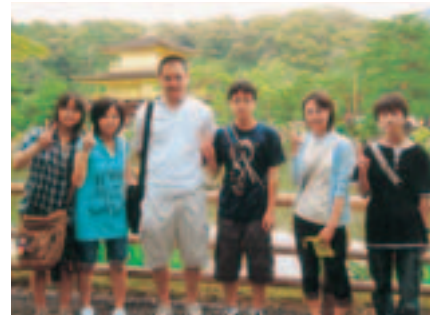
楽しかった修学旅行

京都での班行動では、バスや 地下鉄のルート調べたり多 くの時間を割きました。一番 心配だったのは、なんといつ ても名古屋駅で新幹線の乗り 換えの停車時間が1分だった ことでした。体育館で何度も 練習し、初めは3分かかって いた乗車もついに40秒ぐら いできました。全員無事に 予定どおり帰ってくるという