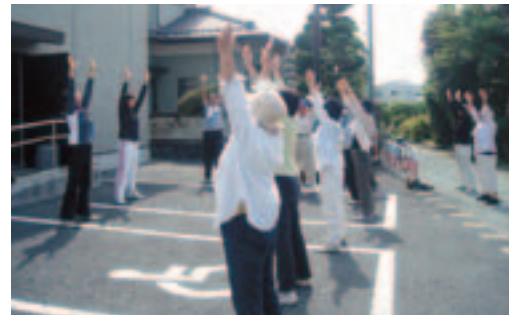
牛島歩こう会 歩く前にみんなで体操!