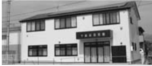
太陽光発電設備を備えた下島自治会館