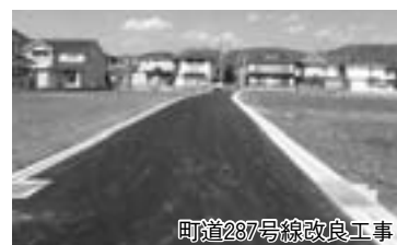
町道287号線改良工事