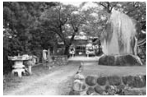
下島のお祖師さん