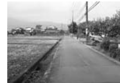
矢倉沢街道(宮台地先)

ぶらりと歩きながら開成町の文化を発見、再確認してみませんか。開成町の残る遺蹟を紹介します。