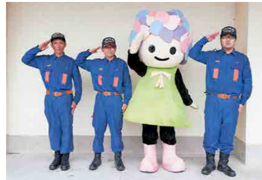
あじさいちゃんとなんたに入団した3人