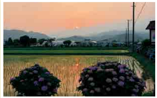
2017開成町あじさいまつり