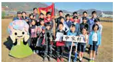
優勝した中家村自治会チーム