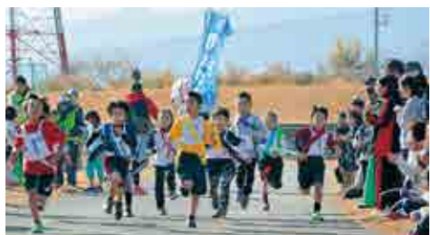
一斉によーい、スタート！！