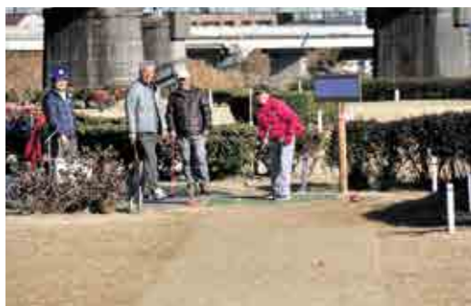
寒さに負けず楽しく笑顔でプレー