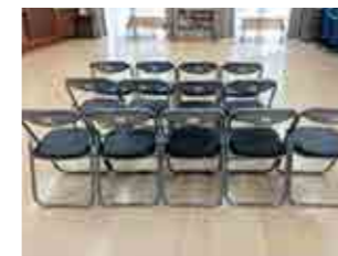
円中自治会 テント、氷削機、会議用テーブル、イス