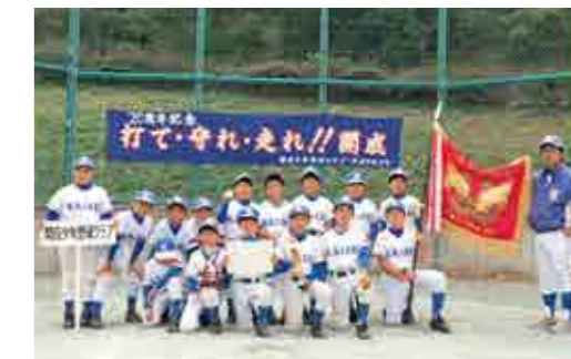
優勝した開成少年野球クラブの皆さん