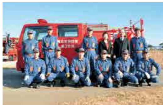
新しくなった小型動力ポンプ付き積載車