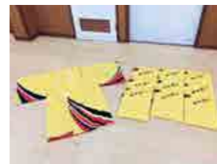
上延沢自治会 会議用テーブル、阿波踊り衣装、カーテン、長型提灯、Tシャツ