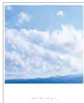
PRイベントなどで配布中!