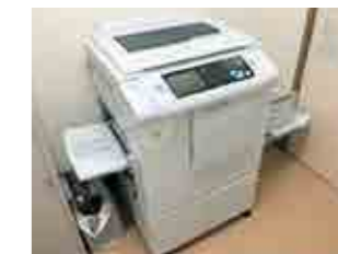
下島自治会 印刷機、広報掲示板

一般財団法人自治総合センターのコミュニティ助成金(宝くじ収益金)を活用し、上延沢、円中、榎本、下島の各自治会で自治会活動に必要な合計221点の備品を整備しました。