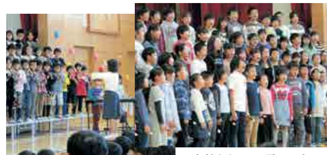
仲間の指揮に合わせて