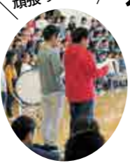
音楽委員も 頑張ってます!