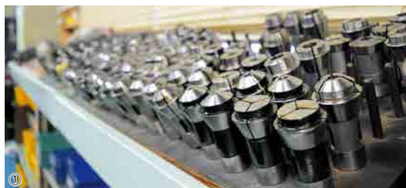
①加工に合わせた機械のパーツ ②③真ちゅう棒から部品を切り出す