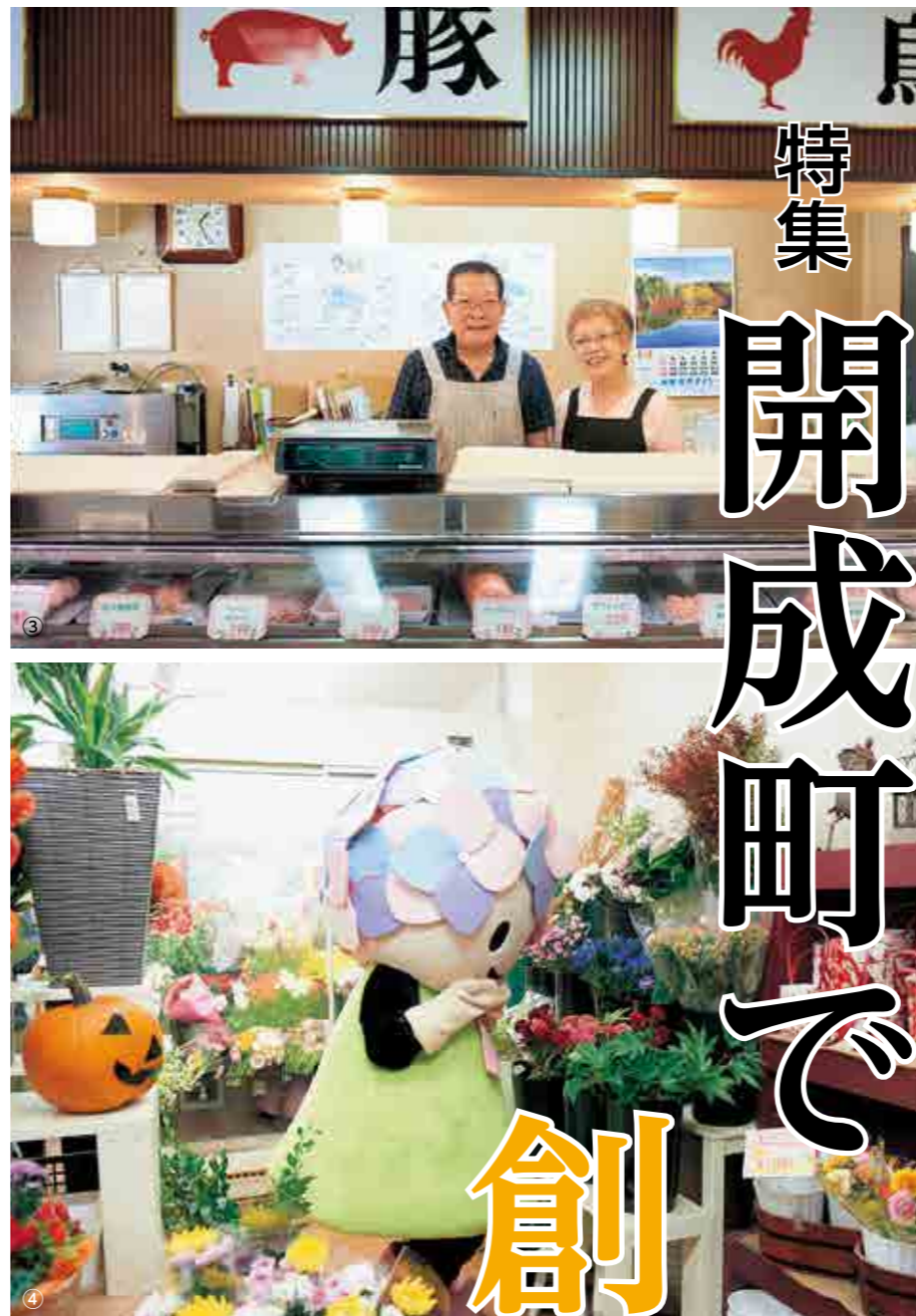
私たちの生活を支える様々なお店 ①丘のうさぎ(洋菓子店)(下延沢) ②サカワプリント(印刷業)(上延沢) ③露木精肉店(下延沢) ④フラワーショップFine!(下島)

の課題や改善策が見えてきます。事業で困ったときは、まずは足柄上商工会にご相談ください。また、地域の特性や足柄地域でのノウハウをふんだんに盛り込んだ勉強会やセミナーも随時開催しています。ぜひ、お越しください!