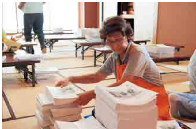
▲5,400部を各自治会や公共施設ごとに分けます