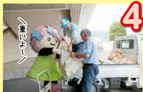
4 軽トラックで各自治会や公共施設へ！