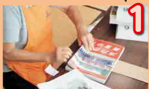
1 各組の世帯数ごとに数えます