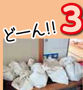
3 自治会ごとに袋に入れます