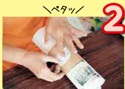
2 各組ごとに包装し、シールを貼ります