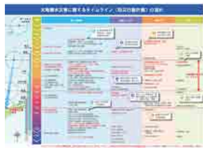
◀タイムラインの流れ

「いつ」「誰が」「何をするか」の対応を時系列にまとめた「大規模水害に関するのタイムライン（防災行動計画）」の整備を進めます。災害時に発生する様々な状況をあらかじめ予測し、災害時に各機関が連携した対応がとれる体制を整えます。