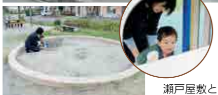
クライミングに挑戦中!

瀬戸屋敷と開成町役場のほぼ真ん中に位置する松ノ木河原第一公園。滑り台やクライミングなど体をたくさん使う遊具があります。屋根つきの休憩スペースや多目的トイレもあるので、長い時間遊べます。