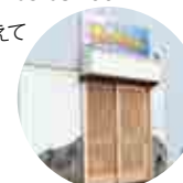
2階は小上がりなので、赤ちゃんと一緒にでも安心!