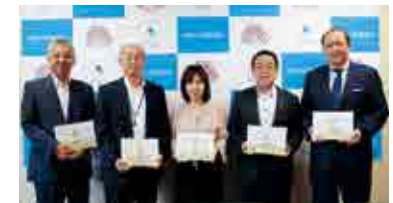
左から、府川町長、井上教育長、中川理事長、山田相談役、守屋副理事長