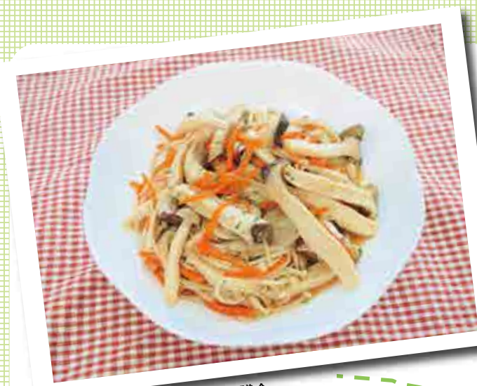
協力: 開成町食生活改善推進協議会

★材料★(4人分) ○えのきだけ…1袋(100g) ○ぶなしめじ…1袋(100g) ○エリンギ…1パック(100g) ○人参…20g ○パセリ…適量 【マリネソース】 ○レモン汁…大さじ1/2 ○酢、オリーブ油…各大さじ1 ○砂糖…小さじ1 ○濃口醤油…小さじ2