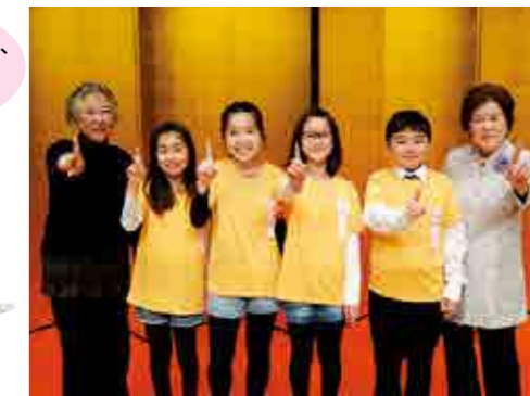
開成小学校No.1チームと交通指導隊の皆さん