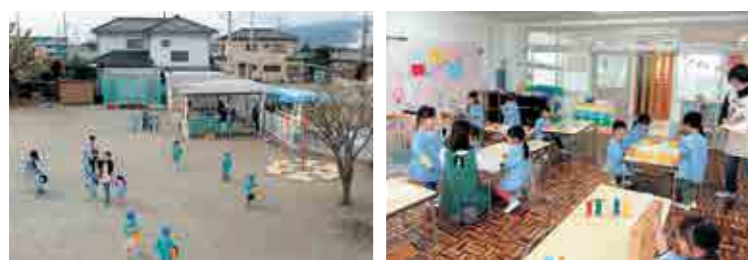
▲元気に登園! ▲友達と一緒に室内遊び