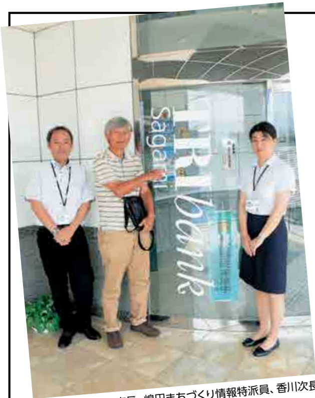
▲左から、三宅支店長、嶋田まちづくり情報特派員、香川次長