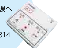
▲特殊詐欺対策機能を持つ録音機