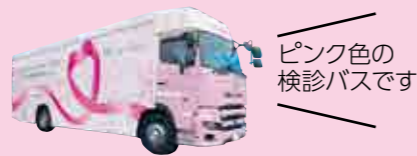
ピンク色の 検診バスです