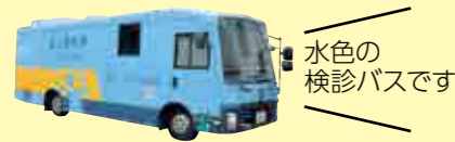
水色の 検診バスです