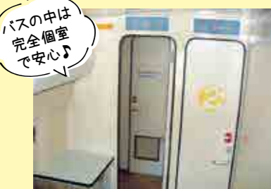
バスの中は 完全個室 で安心♪