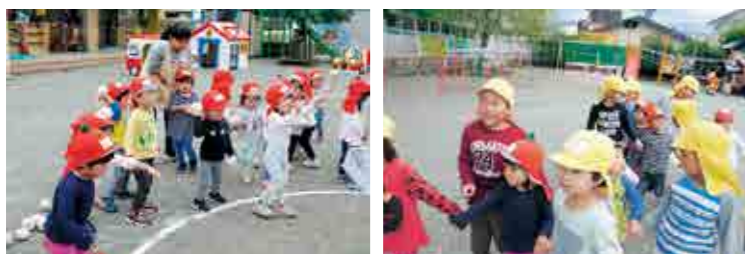
▲頑張った!ミニ運動会