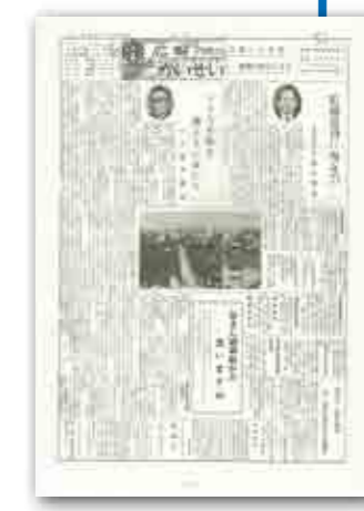
昭和39年3月25日発行 人口:5,638人(1,082世帯)

この号から、表裏2ページの1枚物から、表紙付のB5判冊子となりました。 主な記事は、当初予算の紹介など。 また、ページ数を増やし特集が生まれ、「郷土の歴史」などの連載記事もスタートしました。