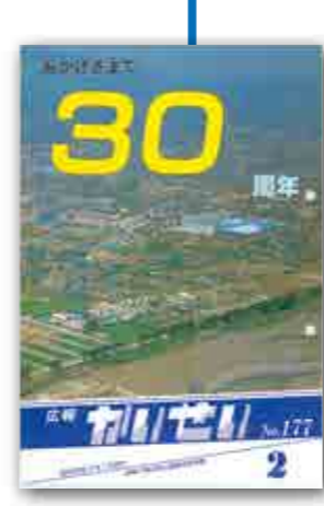
昭和60年2月1日発行 人口:11,080人(3,027世帯)

町制施行30周年を記念し、初めて表・裏表紙がカラーになりました。 町制施行後の30年間の主な出来事や町の動きの振り返りを8ページにわたって特集しました。