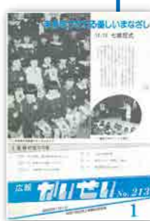
昭和63年1月1日発行 人口:11,499人(3,146世帯)

この号から、毎号全面フルカラーになりました。 主な記事は、町制施行60周年記念の催しの紹介や、同年5月に街開きが行われたみなみ地区の公園の紹介などを掲載しています。