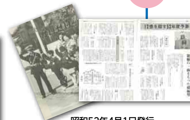
昭和52年4月1日発行 人口:10,100人(2,515世帯)

町制施行30周年を記念し、初めて表・裏表紙がカラーになりました。 町制施行後の30年間の主な出来事や町の動きの振り返りを8ページにわたって特集しました。