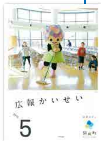
平成27年5月1日発行 人口:16,955人(6,245世帯)

町制施行60周年を契機に取り組んだ町のブランディング事業の一環として、タイトルロゴの変更、表紙や各ページに「あじさいちゃん」を積極的に活用する等、デザインをリニューアル。 また、広報を町民の皆さんと町とのコミュニケーションツールとして捉える「対話型・協働型」の広報づくりを展開しています。