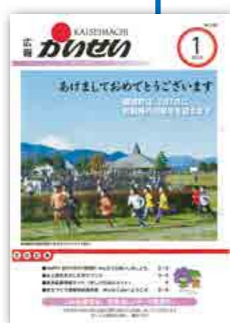
平成27年1月1日発行 人口:16,867人(6,169世帯)

町制施行60周年を契機に取り組んだ町のブランディング事業の一環として、タイトルロゴの変更、表紙や各ページに「あじさいちゃん」を積極的に活用する等、デザインをリニューアル。 また、広報を町民の皆さんと町とのコミュニケーションツールとして捉える「対話型・協働型」の広報づくりを展開しています。