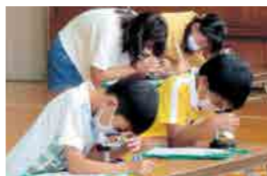
▲慎重にピントを合わせます