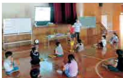
▲観察ポイントを真剣に聞く5年生