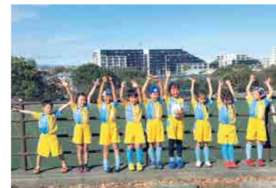
▲優勝したあしがらタグラグビークラブ(低学年)のメンバー

県立保土ヶ谷公園ラグビー場で開催された「2020年神奈川県タグラグビー交流大会」の小学校低学年の部において、町に拠点を置くあしがらタグラグビークラブが優勝しました。高学年の部には当クラブから2チームが出場するなど、いま開成町では、ラグビー熱がにわかに高まっています。