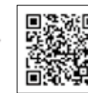
認知症に関する広報はコチラ!!