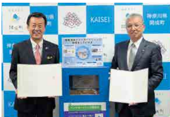
▲ジット株式会社代表取締役(左)とカートリッジ回収箱 ※回収箱は町民センター・福祉会館に設置しています。