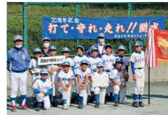
▲優勝した開成少年野球クラブのメンバー

5年生主体の少年野球大会である「令和2年度 足柄上郡ジュニア大会」が中井町で開催され、開成少年野球クラブが練習の成果を発揮し優勝、開成イーグルスが準優勝を飾りました。新型コロナウイルスの感染拡大によって大会の開催も危ぶまれましたが、対策をしっかりと取り、他町の子どもたちと交流することができました。