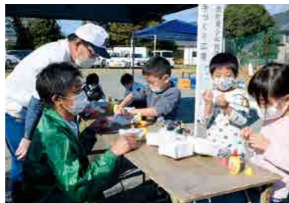
▲青少年指導員と工作に夢中になる子どもたち

※プレイパークとは、子どもたちが自由な発想で遊び、作りあげていく遊び場です。次回は2月頃を予定しています。