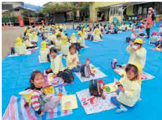
▲園庭で距離を取っての芋煮会