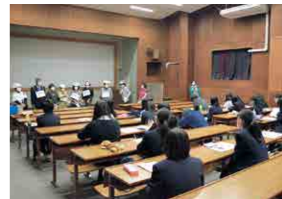
▲真剣に受講する生徒たち