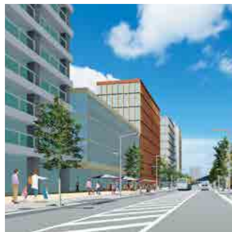
▲イメージ図(町のめざす将来像)