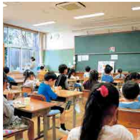
▲第3学童保育所(開成南小学校内)

町民の健康、生活や経済活動を守るため、引き続き感染症対策に取り組めます。また、「新しい生活様式」に適合した町民生活の定着を図るとともに、更なる成長を遂げるための施策を推進していきます。