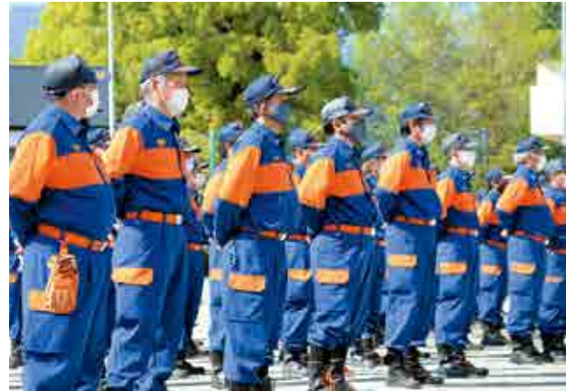
▲町内全分団が集結した