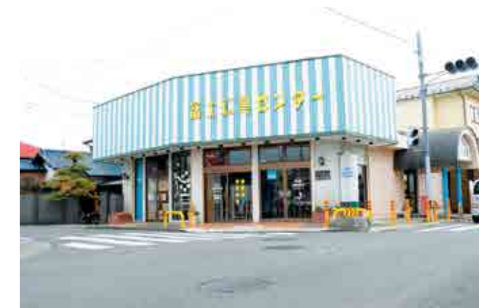
▲生まれ変わった旧「富士寝具センター」(下延沢)

3月12日(金)、延沢にある空き店舗が、町商工振興会の手によってシェアオフィス・ワーキングスペースとして生まれ変わりました。『KAISEI chikamichi workspace』と名付けられたこの施設は、創業のハードルを下げることによって、さまざまな人が起業に挑戦し、町が活気づくことを目的としています。