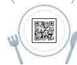
子育て健康課 管理栄養士