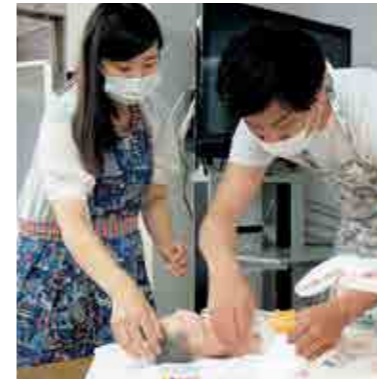
パパも一緒に沐浴の練習