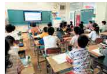
▲大型電子黒板で工場見学