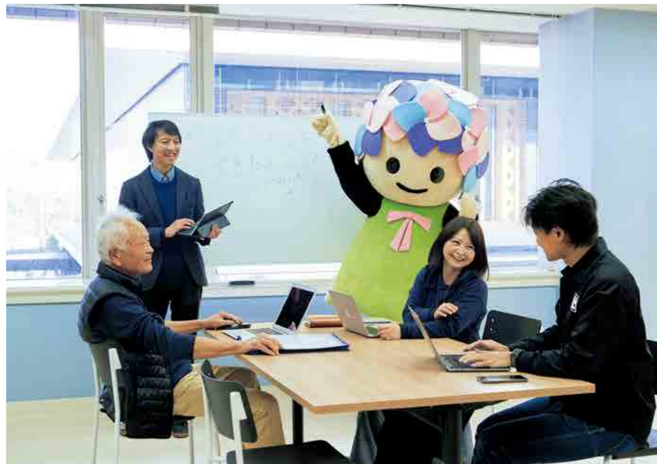
▲利用登録団体、開成町100人カイギの皆さん。インタビュー記事はP4に。