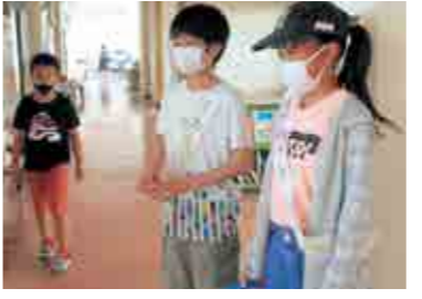
▲タスキをかけて呼びかける企画委員