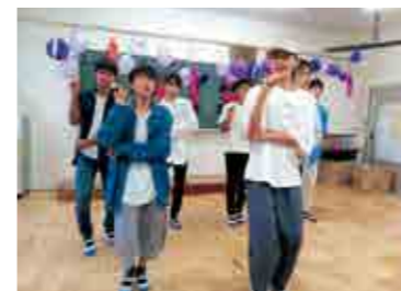
▲ アイドルになりきって！